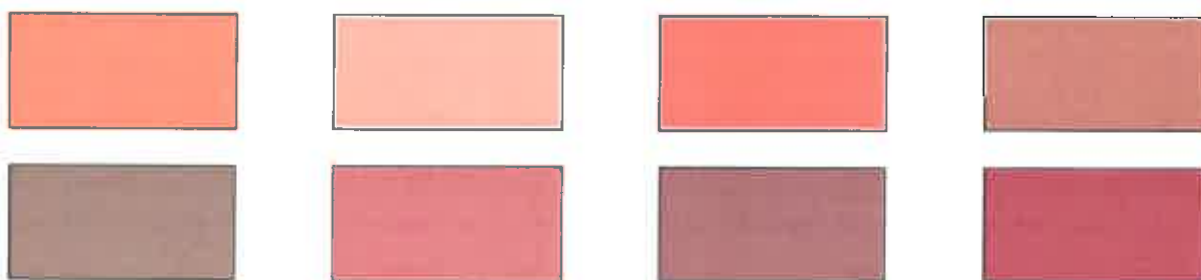
Paletar culori învelitoare